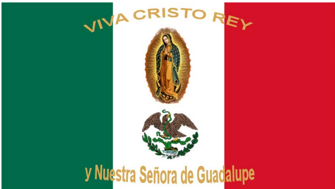
Fahne der katholischen Kämpfer ("Cristeros") in Mexiko

Als der frevlerische Plutarco Elías Calles 1924 in das höchste Staatsamt gelangte, verschärfte sich unter seiner Regierung, die nach einem Worte Papst Pius' XI. völlig von der Freimaurerei kontrolliert war, die Verfolgung noch. In Anwendung der gottlosen Verfassung erließ er drei neue Gesetze, wovon das zweite, genannt Ley Calles , 1926 die Einstellung aller kirchlichen Veranstaltungen mit Teilnahme von Priestern in den Kirchen erzwang. Diese Maßnahme brachte das Faß zum Überlaufen. Die Katholiken, sowohl Bauern auf dem Lande als auch Studenten und Arbeiter, gingen vom passiven zum aktiven Widerstand über. Die bewaffnete Bewegung war überall spontan. Ihre Anhänger erhielten von den Gegnern wegen ihres Kampfrufes Viva Cristo Rey und wegen der Kreuze, die sie am Halse trugen, die Bezeichnung Cristeros . Es war ein ungleicher Kampf: Die ungenügend bewaffneten Guerilleros standen einer regulären Armee gegenüber. In den drei Jahren, die er dauerte, gab es auf beiden Seiten zahlreiche Opfer. Als der Konflikt notdürftig beigelegt war, ermordeten die lügnerischen Freimaurer trotz gegenteiliger Zusage noch viele Verteidiger der Kirche. Papst Johannes Paul II. sprach im Jahre 2000 22 mexikanische Priester und drei Laien heilig; 2005 wurden 13 weitere Märtyrer zur Ehre der Altäre erhoben.