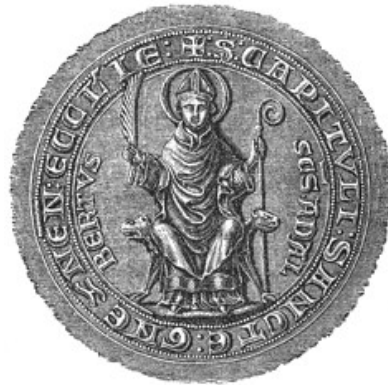
Siegel des Gnesener Domkapitels mit der innern Inschrift S(an)c(tu)s ADALBERTUS